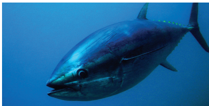
Le thon rouge et le pélican dalmate, deux espèces qui se rétablissent grâce à des programmes de conservation spécifiques